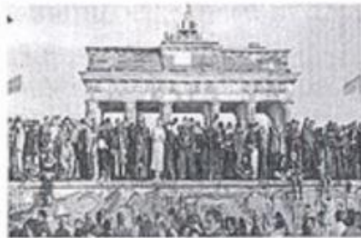
1. La chute du mur de Berlin

Histoire : Quelques temps forts du XXe siècle en France, en Europe et dans le monde (6 points)