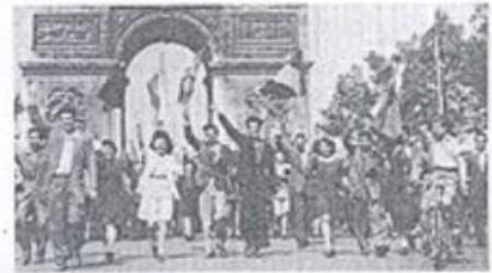
2. La libération de la France