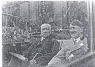
5. L'arrivée d'Hitler au pouvoir