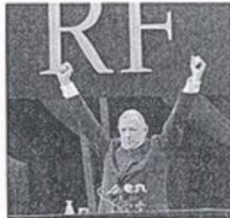
3. La naissance de la Vème République