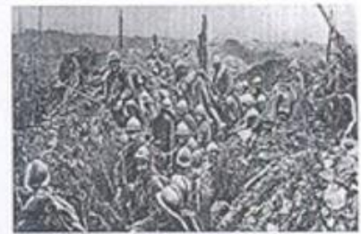
4. La Première Guerre mondiale