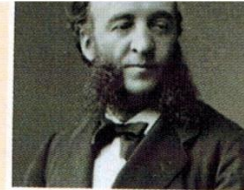
Jules Ferry, discours au parlement, 28 juillet 1885.

On peut rattacher le système d'expansion coloniale à trois ordres d'idées : à des idées économiques, à des idées de civilisation, à des idées d'ordre politique et patriotique [...]. Les colonies sont, pour les pays riches, un placement de capitaux des plus avantageux [...]. Les races supérieures ont un droit vis-à-vis des races inférieures. Elles ont le devoir de civiliser les races inférieures. Je dis que la politique coloniale de la France, celle qui nous a fait aller, sous l'Empire, à Saïgon, en Conchinchine, celle qui nous a conduits en Tunisie, celle qui nous a amenés à Madagascar s'est inspirée d'une vérité [...] : une marine comme la nôtre ne peut pas se passer, sur la surface des mers, d'abris solides, de défenses, de centres de ravitaillement.