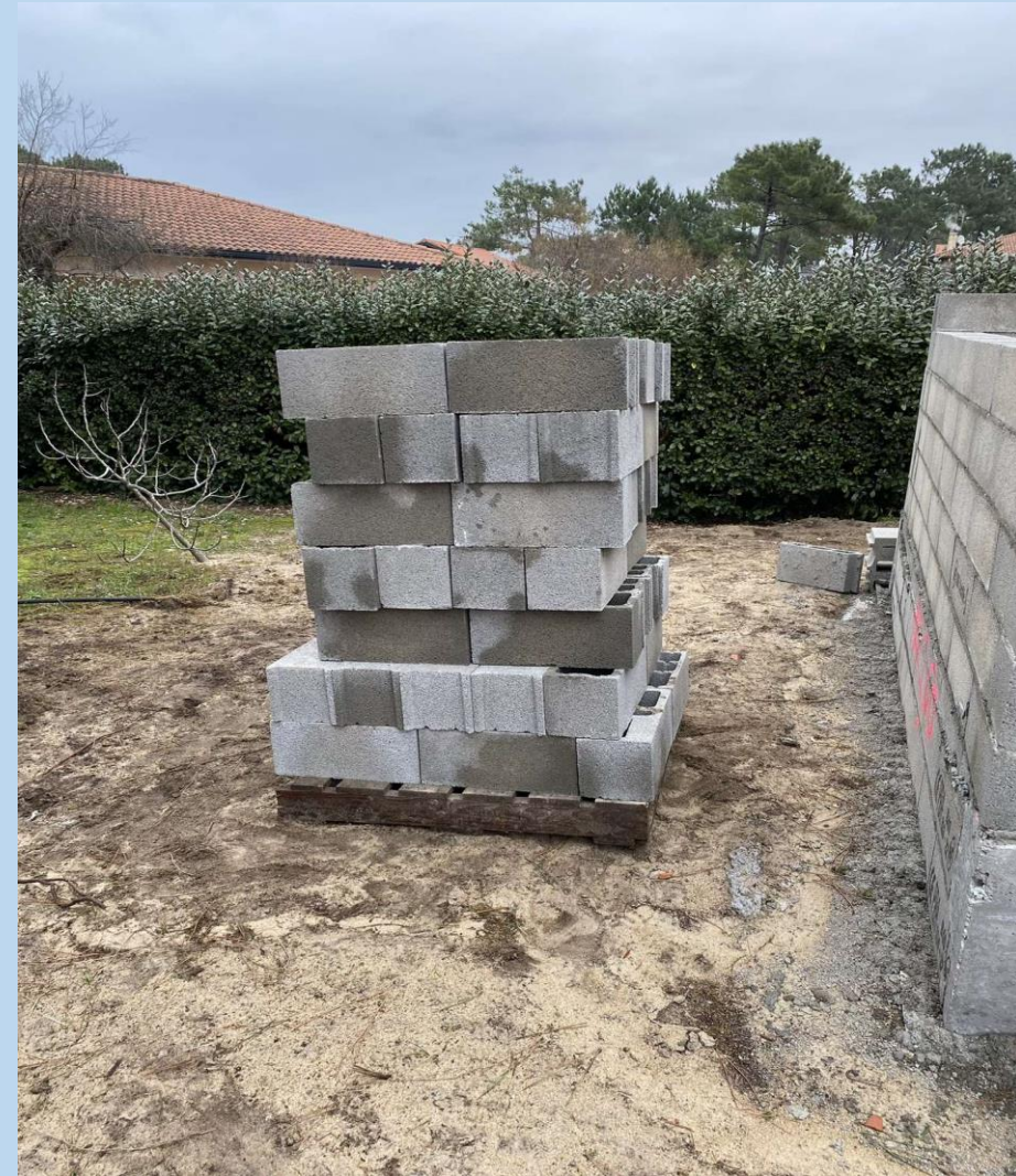
Photographie prise par moi après avoir tout déplacer avec une brouette.