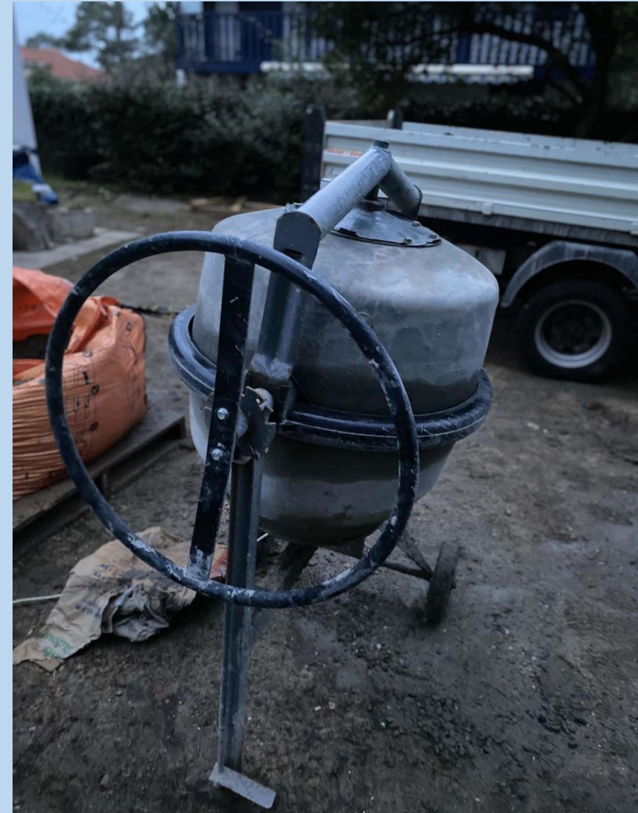
Photographie d'une bétonnière prise par moi.