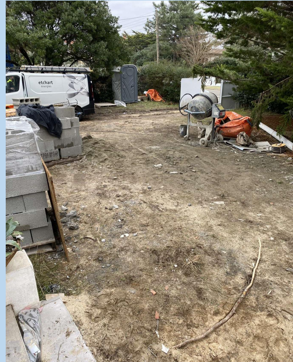
Photographie du chantier où j'ai effectué mon stage prise par moi.

Spécialisé dans le BTP depuis le 01/01/2006, Arroka fait partie des entreprises incontournables dans les Landes. Ce stage a également été pour moi un moyen de découvrir le monde professionnel. En rejoignant les rangs de Arroka, je me suis tout d'abord familiarisé avec le fonctionnement d'une entreprise. Rapidement mis à l'aise par les membres de mon équipe, j'estime avoir beaucoup appris au cours de cette semaine de stage.