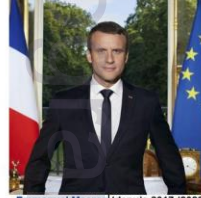
Emmanuel Macron (depuis 2017)