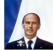
Valéry Giscard d'Estaing (1974-1981)