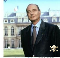
Jacques Chirac (1995-2007)