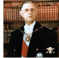
Charles de Gaulle (1959-1969)