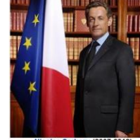
Nicolas Sarkozy (2007-2012)