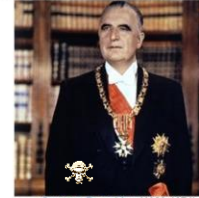
Georges Pompidou (1969-1974)