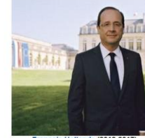
François Hollande (2012-2017)