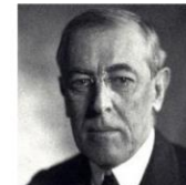
Wilson Président des États-Unis