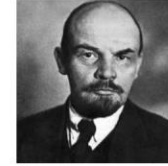
Lénine révolution d'octobre 1917