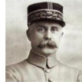
Pétain Bataille de Verdun