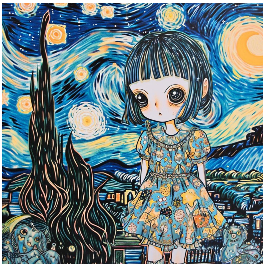
La Nuit étoilée, tableau du peintre Vincent van Gogh, 1889, huile sur toile, 74x92 cm.

Le mensonge est dans ce cas un non-sens philosophique car il pervertit la perception de la réalité, mine la confiance, compromet l'intégrité personnelle et alimente un cycle de tromperie et de désillusion. Tout comme les filtres sur les réseaux sociaux déforment l'image de soi, le mensonge déforme la vérité de l'existence, nous éloignant ainsi de la réalité et de notre propre essence.