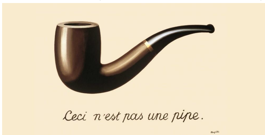
La Trahison des images est une peinture à l'huile sur toile du peintre René Magritte

Commençons par examiner le mensonge chez les enfants. Les enfants mentent souvent pour diverses raisons, notamment pour éviter les punitions, pour obtenir ce qu'ils veulent, ou pour se protéger des conséquences de leurs actes. Le mensonge peut être perçu comme un mécanisme de défense naturel chez les enfants, qui sont encore en train de développer leur sens de la morale et de la responsabilité.