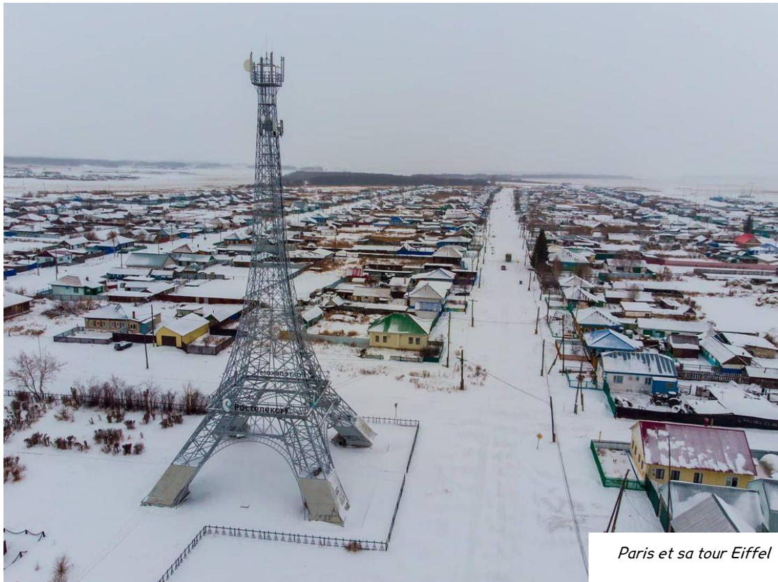
Paris et sa tour Eiffel

En 2024 de nombreuses élections présidentielles se préparent dans le monde. On s'attend donc à une forte