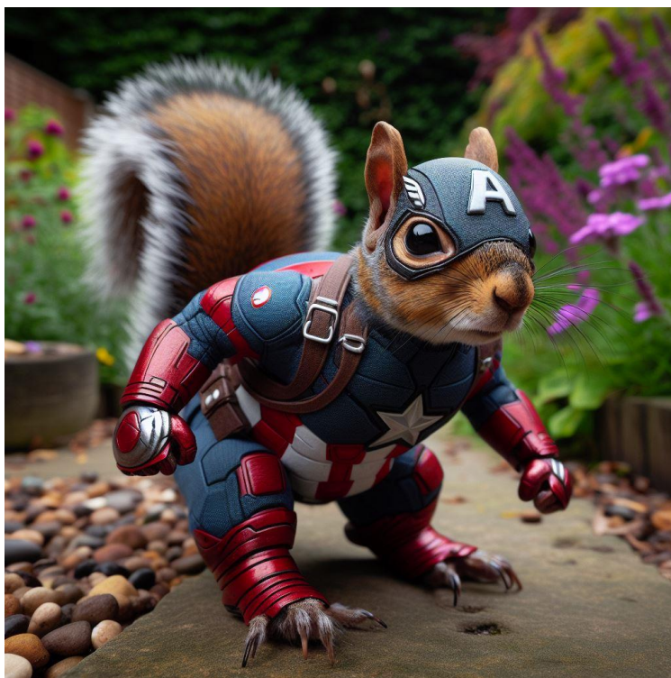
Extrait du film, Captain America sortie le 14 décembre 1990 aux États-Unis. Trois autres suivront en 2011, 2014 et 2016.

Dans chaque contexte, le mensonge peut être interprété comme une tentative de navigation à travers les complexités de la vie humaine, où la vérité absolue peut souvent être difficile, voire impossible, à atteindre.