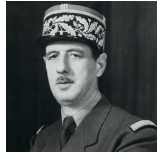
Charles de Gaulle → chef du GPRF, refonde la République

PÉTAIN : frappé d'indignité nationale, condamné à la confiscation de ses biens, à la peine de mort. Peine transformée en emprisonnement à perpétuité, meurt en prison le 23 juillet 1951.