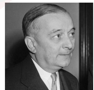
Georges Bidault → président du Conseil début de la IVe République