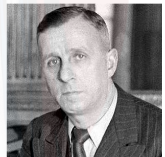
Ambroise Croizat → sécurité sociale