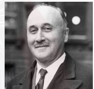
Jean Monnet → reconstruction économique