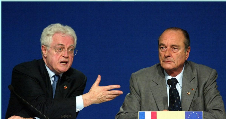
Lionel Jospin et Jacques Chirac lors de la troisième cohabitation (1997-2002).

Une cohabitation correspond à une situation dans laquelle le président de la République et la majorité de l'Assemblée nationale appartiennent à des camps politiques opposés.