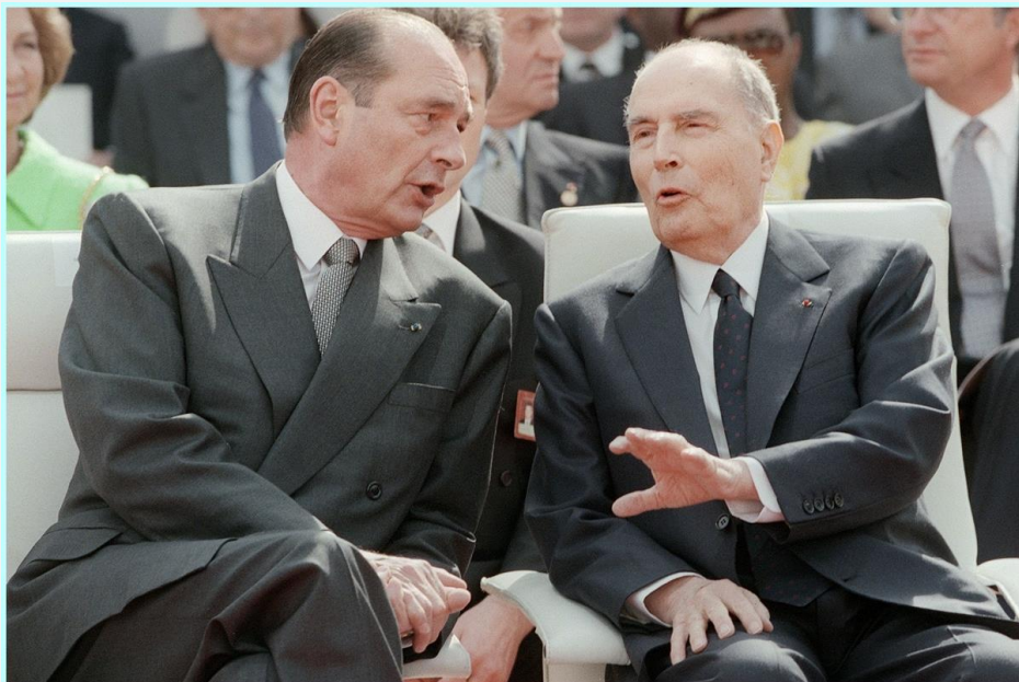
François Mitterrand et Jacques Chirac lors de la première cohabitation (1986-1988).